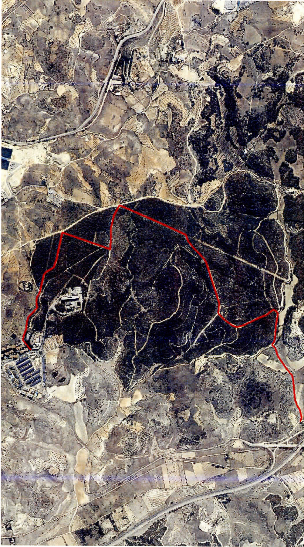
Itinerario autorizado por la D.G. Medio Ambiente